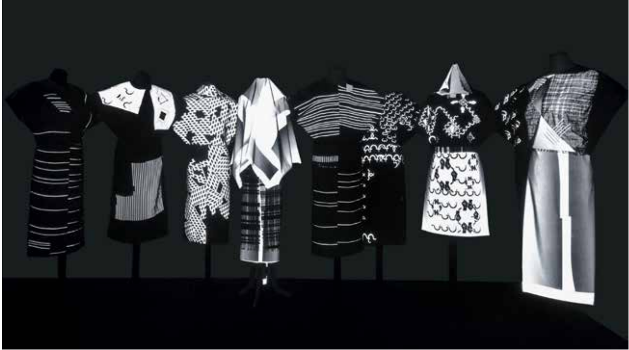
Abb. 11: Alexandra Hopf, Die Bauern/The Peasants (after Malevich) , Version 1.

auf die Bühne, wo sie den (Bühnen-)Boden beackern. Man fragt sich, wo die Grenze zwischen Realität und Fiktion während des Stückes verläuft. Dieser imaginäre Raum ist wichtig. In einer Ausstellungssituation werden die Exponate wie Trachten und Kostüme in einem Museum installiert. Zusammen ergeben sie ein Tableau – wie in der Publikation beschrieben. Der Betrachter wird im Ausstellungsraum durch seine Bewegung einen Sensor auslösen, der die im Dunkeln wie ein mechanisches Ballett reflektierenden Exponate zum Rotieren bringt. An die Bewegung ist programmiertes Licht gekoppelt. Ein Zufallsgenerator wird alle Variationen durchspielen. Wie im Museum gibt es Wandtexte und Texte auf Displays aus dem Programmheft – und auch einen Film.