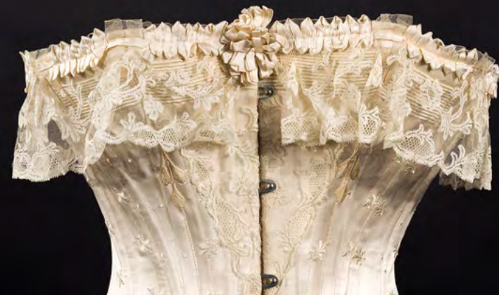
Brautkorsett, um 1880

Die Ausstellung lädt dazu ein, in die Träume von Promis und Menschen „wie du und ich“ aus ganz Europa einzutauchen. Mit ihren unterschiedlichen Hintergründen, Kulturen, Religionen und sexuellen Orientierungen haben ihre Hochzeitsträume dennoch erstaunlich viel gemeinsam.