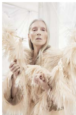
Iris van Herpen, Wilderness Embodied Courtesy

Den Haag (NL) > 17 November 2018 - 24 März 2019