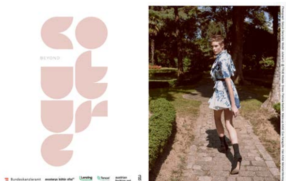
Dress: Patricia Narbón

Beyond Couture - A Cross-Cultural Collaboration in Contemporary Fashion Design Palais Yeniköy, Istanbul (TR) > 23. Oktober - 16. November 2018