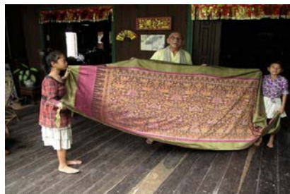
Phelan / Wandbehang für religiöse Zeremonien gefertigt von BTT