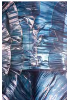
Krizia-Overall, Milano, 1985

St. Gallen (CH) > 15.05.2020 – 24.01.2021 verschoben > 6. Juni 2020 – 21. Februar 2021