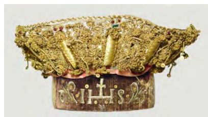
Jungfrauenkrone aus dem Bregenzerwald, Ende 19. Jahrhundert, gepostet am 31.7.2020

Jede Woche stellt die Textilsammlung des Volkskundemuseum Wien ein Objekt aus der Sammlung auf Instagram und Facebook vor, kombiniert mit Informationen zum Objekt und seinen Bedeutungsebenen. Jeder Post erzählt eine kleine Geschichte. So erhalten die Leser und Leserinnen Einblicke in die Textil- und Bekleidungssammlung des Museums und gewinnen einen Überblick über die Vielfalt und die Schwerpunkte dieser großartigen Sammlung.