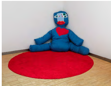
Dardan Zhegrova, Your enthusiasm to tell a story (Blue), 2017, mixed media and sound, approx. 200 x 100 cm, dimensions variable, courtesy the artist and LambdaLambdaLambda, Prishtina

Erfurt (D) 5 September – 23 October 2020