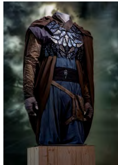
Costume design: Urs Dierker. Plinth: Liisa Poskiparta.

Ich möchte Sie auf die Ausstellung Naturally Dramatic: Sustainable Textile and Material Design for Stage and Film Costumes, mit Arbeiten von mir in Zusammenarbeit mit der Forschungsgruppe Biobased Colloids and Materials (BiCMat) aufmerksam machen. In den letzten neun Monaten habe ich mit BiCMat Forschern an Materialien für nachhaltige Textildesign von Film- und Theaterkostüme gearbeitet. Eine Auswahl der Textilien wird vom 2. September bis 12. Oktober im Rahmen der Helsinki Design Week an der Aalto University gezeigt.