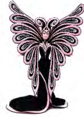
Bob Macie Le Papillon Barbie, Stadsmuseum Almeo

Schoonhoven (NL) > 12. September 2020 bis 31. Januar 2021