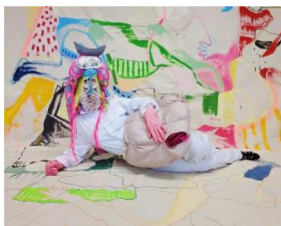
Maske: Nika Timashkova; Malerei und Vulvaobjekt: Stella Meris

Basel/Münchenstein (CH) > 28. November 2020 bis 3. Januar 2021