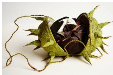
Bag and purse, by Emily Jo Gibbs, 1996, UK. Museum no. T.531:1, 2-1996.

From rucksacks to despatch boxes, Birkin bags to Louis Vuitton luggage, Bags: Inside Out explores the style, function, design and craftsmanship of the ultimate accessory. (Textquelle: Webseite, Link s. u.)