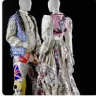
Frauen- und Männerkostüm „Die Europäer“ (2010–2011) von Stephan Hann

Online > Berlin (D), Museum Europäischer Kulturen