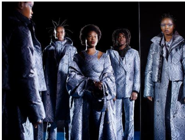
© Daily Paper, FW21 campaign Bildquelle: Webseite, Link s. u.

Amsterdam (NL) > 18 september 2021 – 3 april 2022