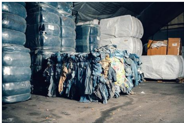
A discarded bale of jeans, waiting to be recycled into Circulose — a new material made by recovering cotton from worn-out clothes for new garments. Image by Alexander Donka/Renewcell. Bild- und Textquelle: Webseite, Link s. u.

London (UK) > Opens Saturday 23 October 2021