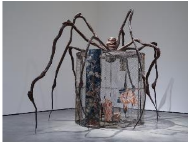
Louise Bourgeois, Spider, 1997

Berlin (D) > 22. Juli bis 23. Oktober 2022