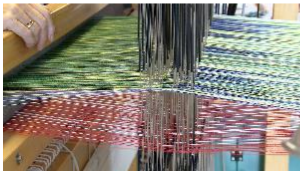
Kædefarver Lise Frølund.

6 Textilkünstlerinnen aus 4 Kontinenten zeigen einzigartige Jacquardgewebe, hergestellt auf digitalen Handwebstühlen