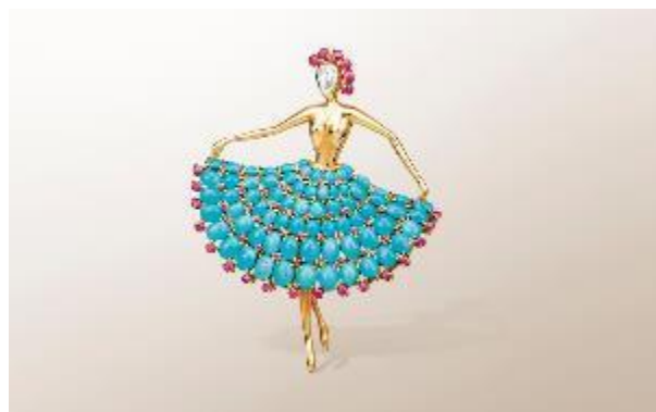
Ballerina clip, 1952, Van Cleef & Arpels Collection

London (UK) > 23 SEPTEMBER – 20 OCTOBER 2022