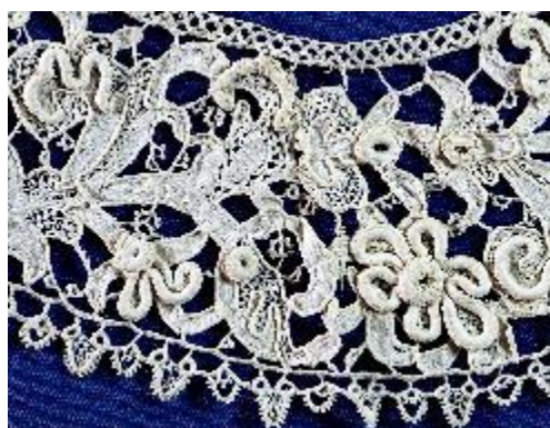
Kragendetail (7 cm Breite), Venezianische Reliefspitze (Gros Point de Venise), spätes 16.Jh.