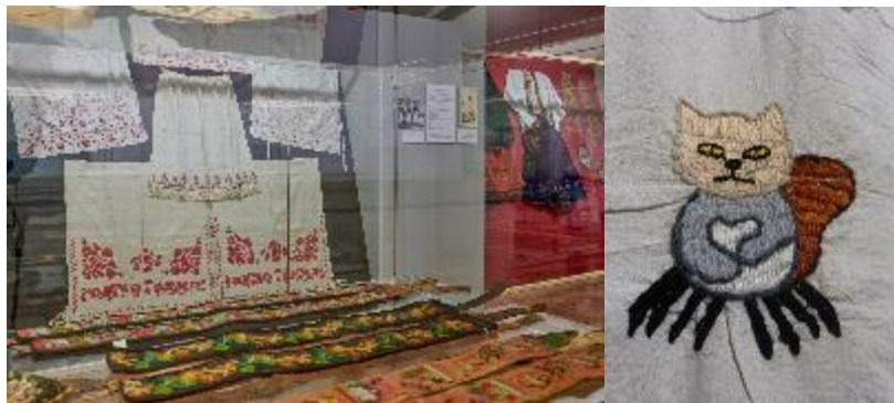
Foto 1: Die Vielfalt der traditionellen Stickerei. Blick durch eine Vitrine. Foto 2: "Magisches Wesen", 5.

Frensdorf (D) > 8. April – 1. November 2022