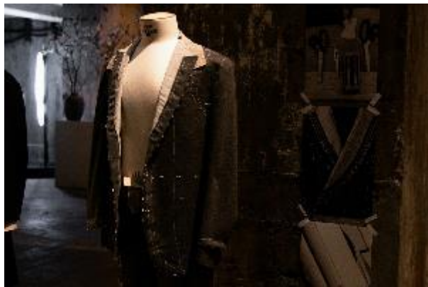
Impression vom BERLINER SALON im März 2022