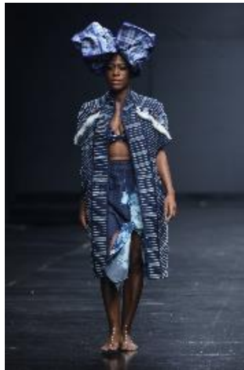
DAKALA CLOTH ensemble, 'Who Knew' collection, Abuja, Nigeria Spring/Summer 2019.

Spanning iconic mid-20th century to contemporary creatives through photographs, textiles, music and the visual arts, Africa Fashion explores the vitality and global impact of a fashion scene as dynamic and varied as the continent itself. (Textquelle: Webseite, Link s. u.)