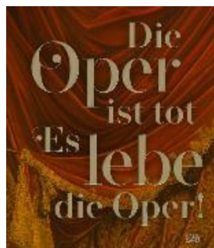
(Cover des Ausstellungskatalogs)

In der Oper verbinden sich verschiedene Formen der Kunst (Musik, Gesang, Schauspiel, Tanz) und des Handwerks (Kostüm, Bühne, Licht) zu einem spektakulären Gesamtkunstwerk. Sie überschreitet die Grenzen der Realität, lebt von dramatischen Extremen, vom Magischen und Irrationalen und ist als Kunstereignis einmalig und vergänglich.