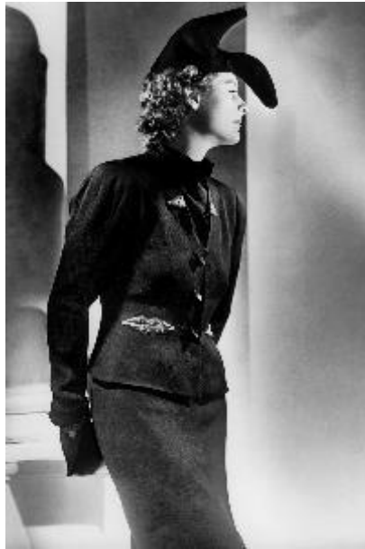
Model wearing black felt Shoe Hat with heel by Elsa Schiaparelli (from L'Officiel De La Mode, October 1937)

Paris (F) > 6 July 2022 – 22 January 2023