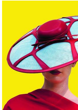
Irene van Vugt, Utrecht, 2019 Leder, Sinamaygewebe, © Irene van Vugt (Bildquelle: Website Museum)